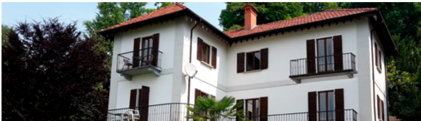
Villa Orta · Lago d'Orta · Via Novara 6 · 28016, Orta San Giulio, Italien

Sie kommen von Verbania über Omegna nach Orta. Hier sehen Sie am Kreisverkehr ein Hotel im Stil eines Moschee-Palastes mit Minarett-Turm.