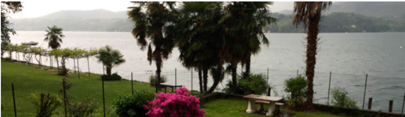
Orta Rustico · Lago d'Orta · Via Novara 6 · 28016, Orta San Giulio, Italien

Sie kommen von Verbania über Omegna nach Orta. Hier sehen Sie am Kreisverkehr ein Hotel im Stil eines Moschee-Palastes mit Minarett-Turm.