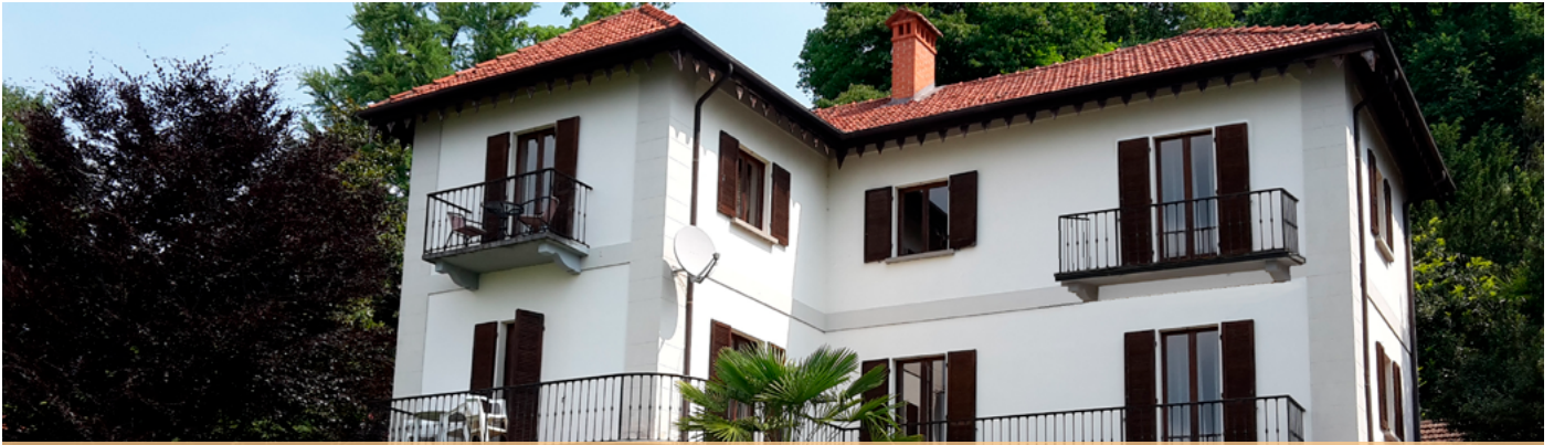
Villa Orta · Lago d'Orta · Via Novara 6 · 28016, Orta San Giulio, Italien

Sie kommen von Verbania über Omegna nach Orta. Hier sehen Sie am Kreisverkehr ein Hotel im Stil eines Moschee-Palastes mit Minarett-Turm.